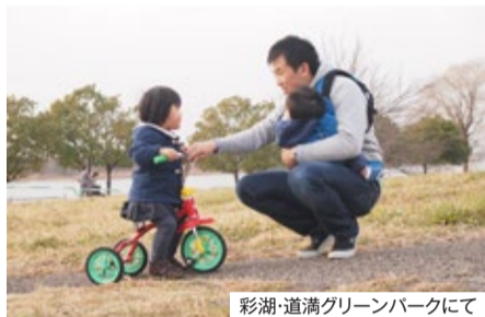
彩湖・道満グリーンパークにて