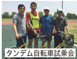
タンデム自転車試乗会

タンデム自転車は、これまで視覚障害者の方々や自転車愛好家の方々を中心に親しまれてきました。前方に誘導者がいること