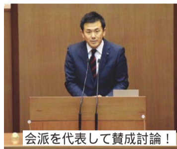
会派を代表して賛成討論！

知事提出の議案は26件あり、23件が原案通り可決、3議案(平成27年度決算認定2件、埼玉県5か年計画の策定)は、それぞれ特別委員会が設置され、継続審査となりました。無所属県民会議はすべての議案に賛成しました。