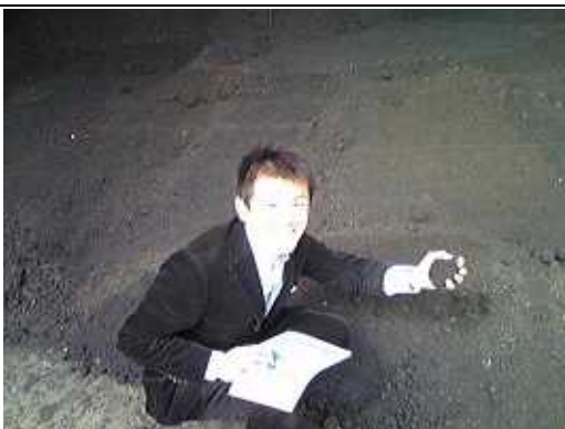
京都府南丹市で家畜の糞からリサイクルされた出来たての堆肥を握りしめる