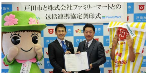
【4月18日の協定締結式】